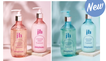
ジェニーハウス クリスタルシルキー SP・TR クリスタルモイスト SP・TR

大人気の洗い流さないタイプのヘアトリートメント入荷! サロン業界注目の美髪成分配合で、傷んだ髪を芯から補修する美容液入りヘアミルク! べた付かないので暑い季節にも!!