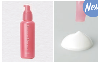
オルビス エッセンスインヘアミルク

大人気の洗い流さないタイプのヘアトリートメント入荷! サロン業界注目の美髪成分配合で、傷んだ髪を芯から補修する美容液入りヘアミルク! べた付かないので暑い季節にも!!