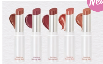
ロムアンド グラスティングメルティングバーム

大人気韓国コスメ、ロムアンドの新作リップ入荷! 軽い塗り心地でツヤ感のある唇に。マスクを外す機会が増えた今、オススメです!!