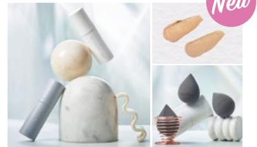
UUUNI プライマー(グロウ/スムース)メイクアップスポンジ

大人気韓国コスメ、ロムアンドの新作リップ入荷! 軽い塗り心地でツヤ感のある唇に。マスクを外す機会が増えた今、オススメです!!